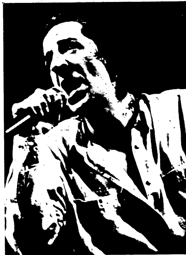
Giorgio Gaber in concerto anche stasera a Firenze: per lui tutto esaurito e bis a non finire

o di Sofri, ed è facile che anche l'incontro con un personaggio problematico come Gaber possa registrare il tutto esaurito. «Si tratta di chiacchierare di cose serie o facete — dice l'interessato —, ma sono molto curioso, come ultimamente spesso mi succede, di verificare la presenza giovanile. Ultimamente è stata altissima, e questo è uno dei motivi principali che mi ha stimolato ad affrontare questo incontro».